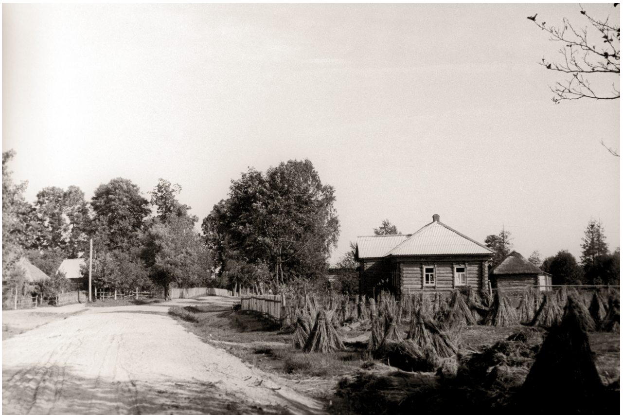
Село Мишковка. 1950-е годы