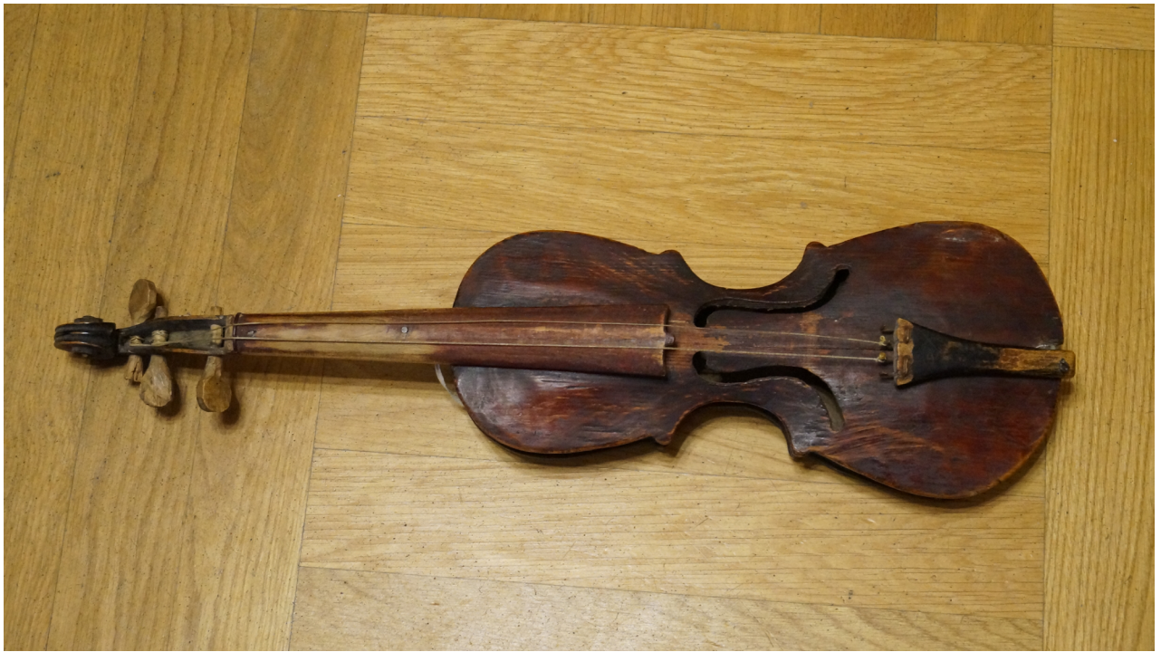
Скрипка трехструнная [из Брянской области]. Коллекция НЦНМ имени К. В. Квитки